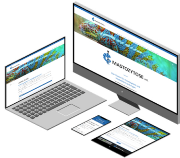
Verein für Mastozytose und Mastzellerkrankungen

"herausragende digitale Kommunikation" ausgezeichnet. Wenig später wurde das zweite Website-Projekt umgesetzt, dieses Mal für den Meisterbetrieb Frühauf Kamine .