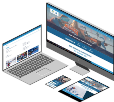
Biathlon Weltcup Oberhof

So konnte das Team Prisma weiter die Vorteile eines Content Management Systems nutzen und hatte beispielsweise Zugriff auf individuell einstellbare Nutzerrechte im Backend, die für solche Veranstaltungsseiten hilfreich sind.