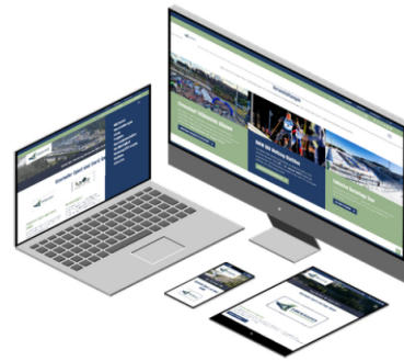
Oberhofer Sport und Event GmbH